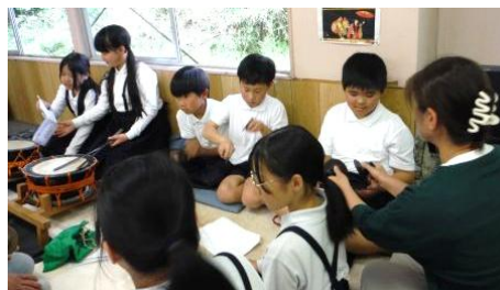
奏楽の練習 難なくこなしています