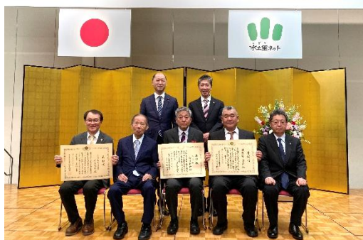
二階会長と受賞者(左端:古川事務局)