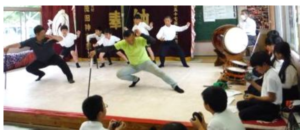
初めて皆で合わせました 素晴らしい!

まずは、今年とのかかる演目「塵輪」の、団員によるお手本の舞をうっとり鑑賞した後、神と鬼と奏楽と、3グループに分かれ、各々練習を行いました。 子どもたちは言葉より、仕草を真似てどんどん覚えていきます。