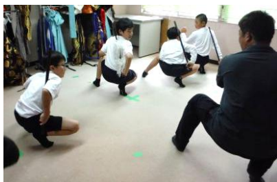
鬼の練習 動きがユニーク