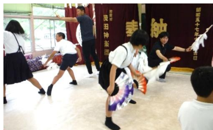
神の練習 覚えるポーズが連続

団員の方は「子ども達の動きはとても自然で筋がいい。君田の子どもたちは、小さい頃から親に連れられ、神楽を見て育っているから。」と目を細めおっしゃいました。 ものの数十分後に、皆で合わせ演奏し舞う姿は、堂々としていて、出来上がりが待ち遠しく感じさせました。