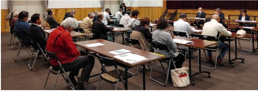
理事 7 名(7 名内)・委員 14 名(16 名内)の出席者がありました

4月25日、君田自治区連合会総会を、穴戸市議会議員、牧浦君田支所長にご臨席頂き開催しました。