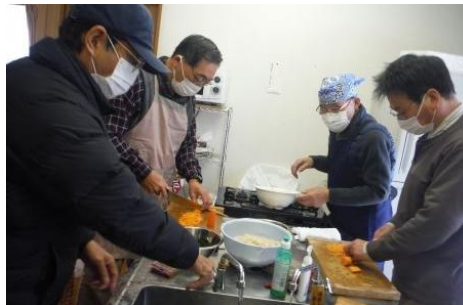
皆さん、真剣そのもの。