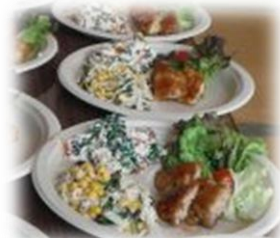
凄い！ とっても美味しく できました。